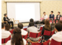
学ぶ場やお(企業同士の学び合い)