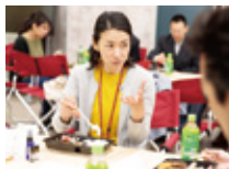
ランチミーティング