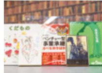
まちライブラリー