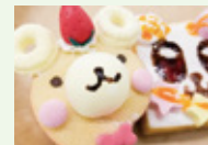
オリジナルのスクイズをつくる