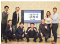
みせるばやおIT道場