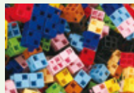
ブロックパズル体験

子どもたちやその家族と一緒にドキドキ・ワクワクできる体験型ワークショップを毎月土・日・祝日を中心に開催。各企業の得意分野を生かしたプログラムが多く、「子どもたちの自由な発想に気づかされる!」と、ワークショップの開催企業様からも好評です。この取り組みは、地域貢献や企業ブランディングにつながります。