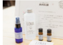
店る場やお(みせるばマルシェ)