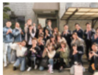
近畿大学xみせるばやおプロジェクト