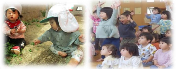
かわいい子どもたちの4月の様子です