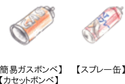
【簡易ガスボンベ】 【スプレー缶】 【カセットボンベ】