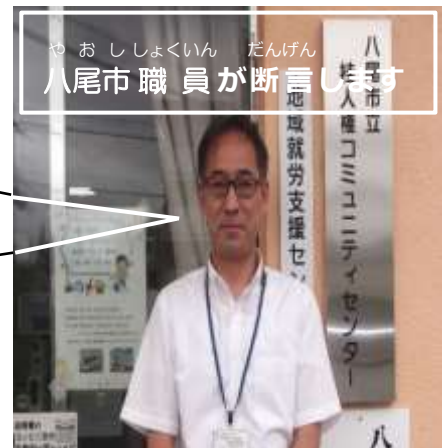
や おししやくいん だんげん 八尾市職員が断言します