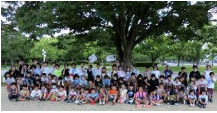
ぜんこうきねんしゃしんと撮りました！ 全校で記念写真も撮りました！

まず最初に1年生から6年生までの縦割りグループでオリエンテリングを行いました。スタートからゴールまでの行程では、高学年が中心となって、グループみんなで助け合いながらチェックポイントをまわり、ゴールをめざす姿が見られ、とてもよい活動になりました。