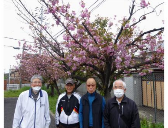
まんかい さくら 満開の桜といっしょに！