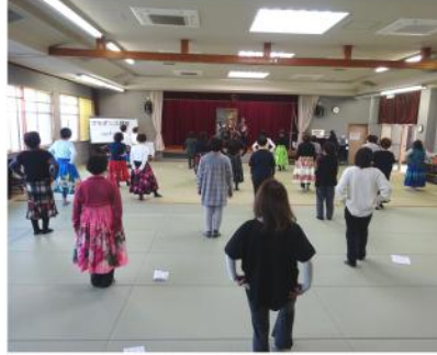
こうざ フラダンス講座