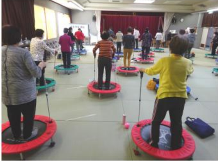
けんこうたいそうこうざ 健康体操講座