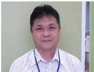
やおしやくしよ 八尾市役所 にしごおりしゅつちやうしよ いちかわ ほ さ 西郡出張所 市川補佐

たいさく こていでんわ るすぼんでんわ せってい 対策は・・・固定電話は「留守番電話」に設定 はんんにん はな だいじ して、犯人と話さないことが大事です！