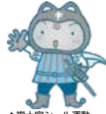
▲複十字シール運動イメージキャラクター「シールぼうや」

本市では毎年約50人近くの結核患者が発生しており、その多くが高齢者です。結核は予防治療ができる病気です。風邪と似た症状が2週間以上続く場合は早めに医療機関を受診しましょう。年に1度は胸部レントゲン検査を受けましょう。また、赤ちゃんは生後5～7カ月の間にBCG予防接種を受けましょう。