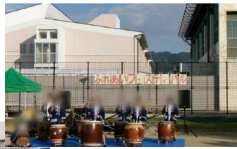
解放研による太鼓