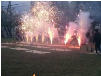
恒例のラストは 花火！

「ふれあいフェスティバル」は、地域教育協議会が主催する最大のイベントです。関係団体が食べものやゲームのお店を出し、太鼓などの催しや花火などを行うイベントとなっています。