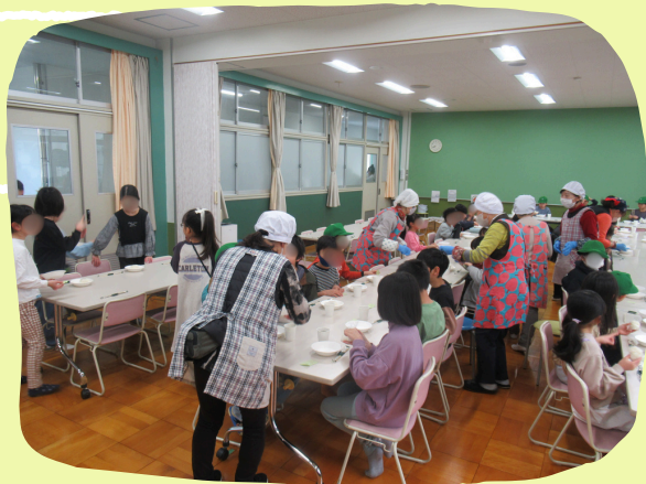
▲歳末たすけあい募金を活用したこども食堂（西山本地区）

赤い羽根データベース「はねっと」より、 八尾市をはじめとする全国市町村の募金の使い道が ご覧いただけます。 インターネットで はねっと と検索してください。