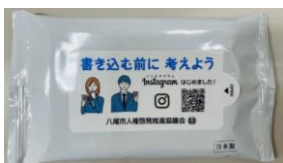
啓発ウェットティッシュ