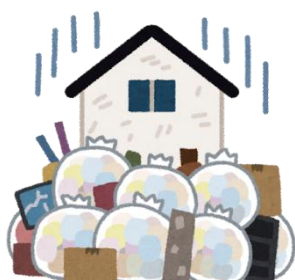
居室にゴミが溜まっている