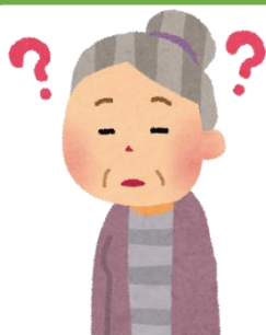
何度も同じ内容を確認してくる