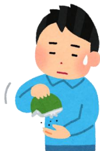
家賃の支払いが滞っている