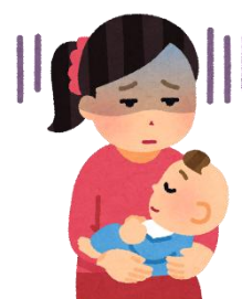
子どものことで悩んでいるようだ