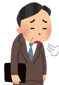
離職などにより、家賃が支払えなくなりそう