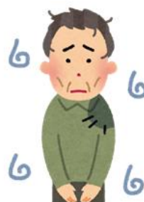
お風呂に入っていない様子である