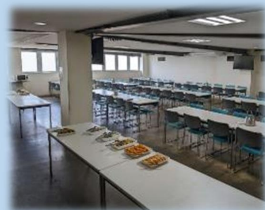
食堂は、全従業員が着席できる広さです！