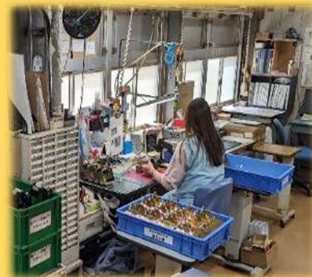
部品の組み立て工程