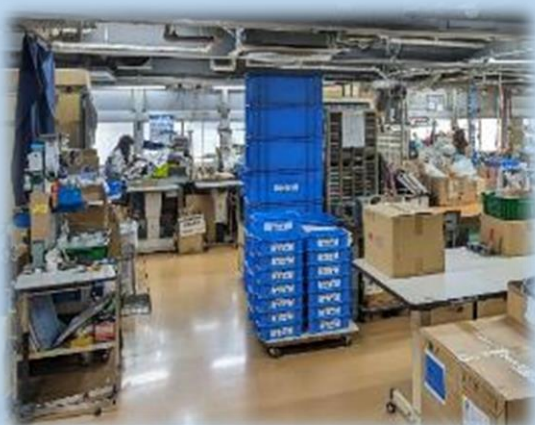
照明はオールLEDで、作業場全体が大変明るいのです！