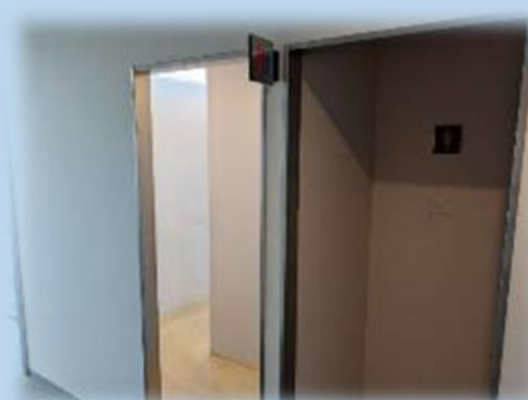
男女別々のトイレ&ロッカールーム(鍵付)を完備