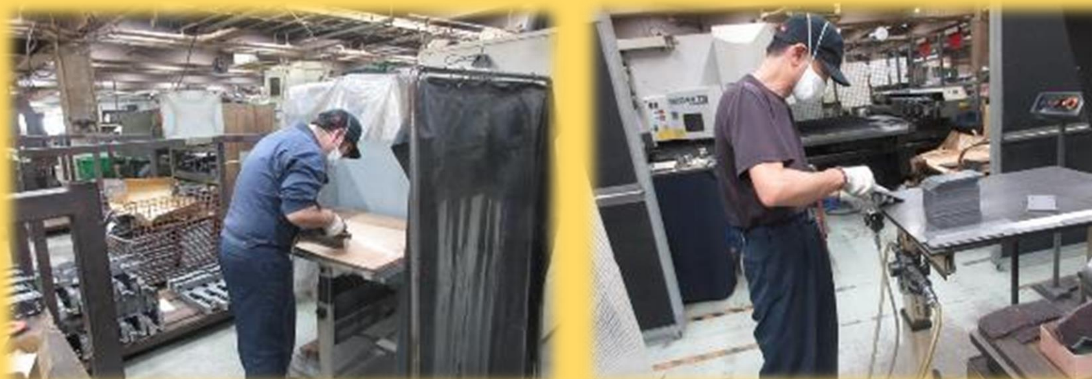
サンダー(やすり掛け)作業工程 (防塵マスク装着)