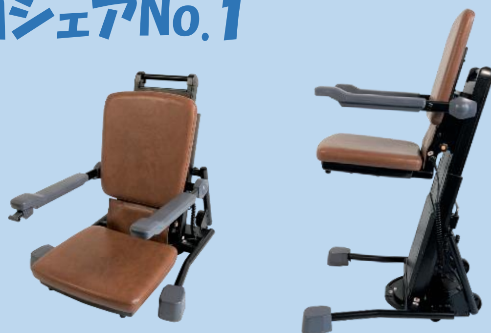
電動昇降座椅子「独立宣言」シリーズ