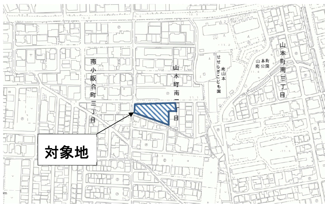
物件 1 案内図