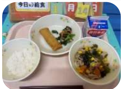
醤油ラーメン 減量ごはん はるまき ほうれん草とツナの和え物

今回の給食は竹淵小学校だけの特別献立でした。給食掲示委員会で話し合い、子どもたちに最も人気の高かった「ラーメン」を取り入れたメニューです。子どもたちも笑顔で味わっていました。