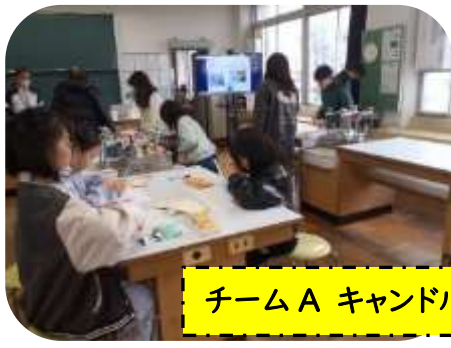
チームA キャンドル作り