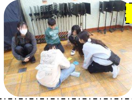
チームF 笑ってはいけない