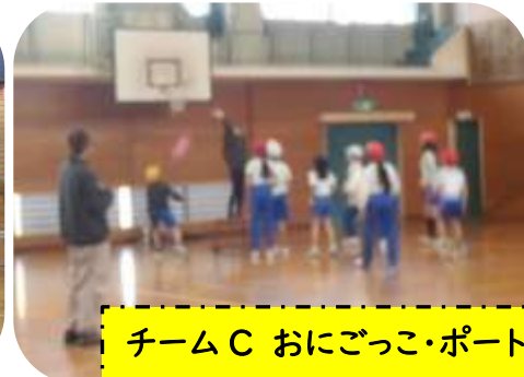
チームC おにごっこ・ポートボール