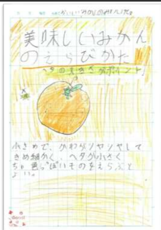
美味しいみかんのえらびかた