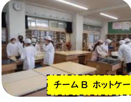
チームB ホットケーキ作り