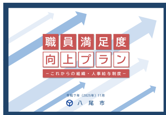
（「職員満足度向上プラン」の表紙）

変化に強い柔軟な組織・人事体制を構築し、市民サービスの質の向上に貢献するため、その礎となる一人ひとりの職員にとって「働き続けたいと思える組織」、より多くの人に「働く場所として選ばれる組織」をめざします。