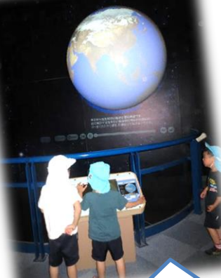
探検ひろばで、地球の満ち欠けや太陽のフレアなど、宇宙の不思議について学ぶコーナーもありました。

4歳児は、宇宙ひろばで、プラネタリウムを鑑賞しました。天井いっぱいに広がるスクリーンに写し出される星にうっとり子どもたちでした。