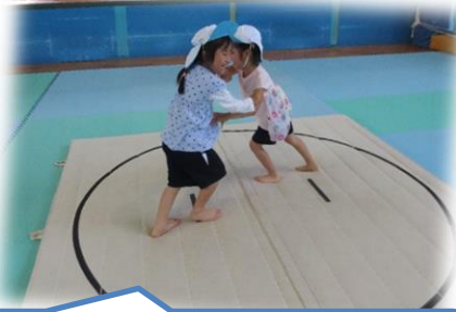
のびのび広場ではつけよいのこった!