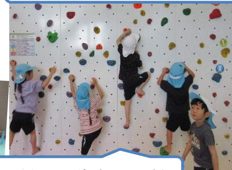
ロッククライミングにもチャレンジ!