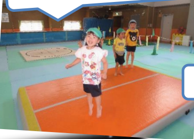
このマット、トランポリンみたいに、とても跳ねるよ!!!