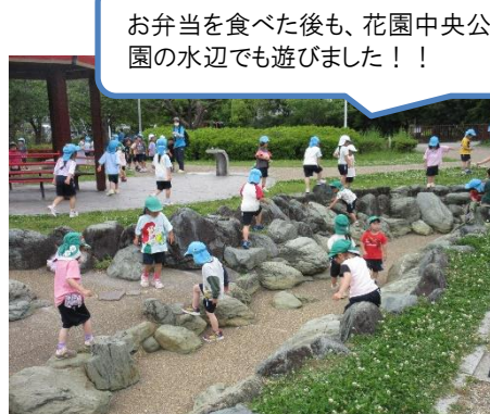
お弁当を食べた後も、花園中央公園の水辺でも遊びました!!!

4歳児は、宇宙ひろばで、プラネタリウムを鑑賞しました。天井いっぱいに広がるスクリーンに写し出される星にうっとり子どもたちでした。