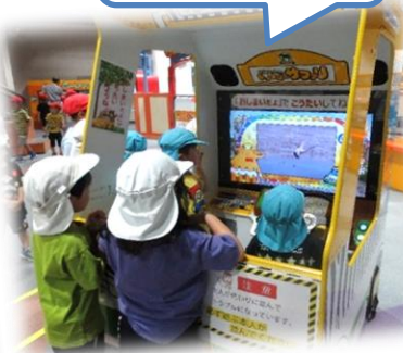
探検ひろばで、乗り物で遊んだよ!