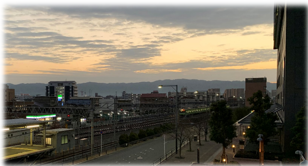
久宝寺駅からの高安山と朝焼け