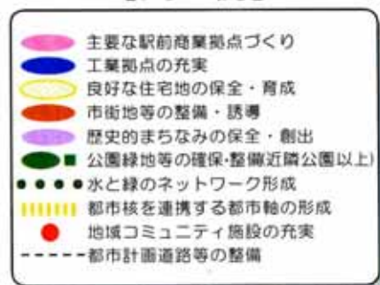
図1.2 西部地域 構想図