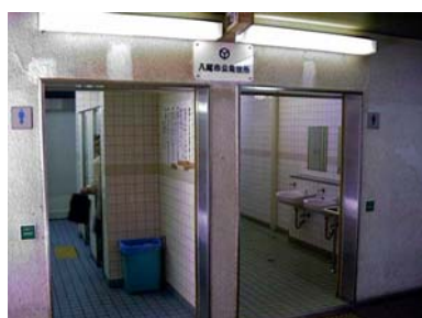
近鉄八尾駅高架下