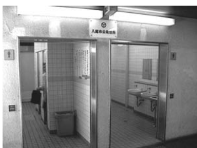
近鉄八尾駅高架下