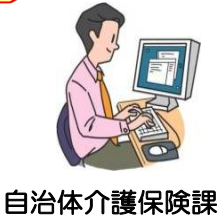
自治体介護保険課