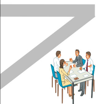
介護事業者連絡協議会