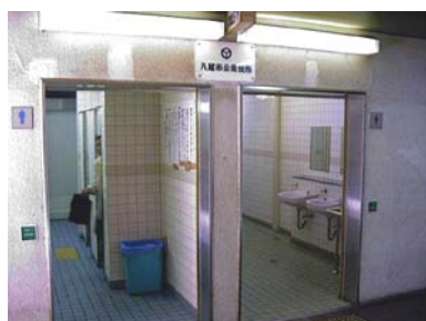
近鉄八尾駅高架下