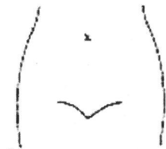
(腸瘻及びびらんの部位等を図示)