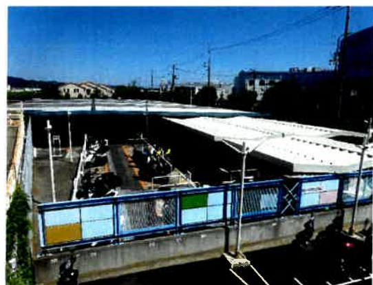
(※写真 地下鉄八尾南駅自転車駐車場中央ゲート 工事前後)