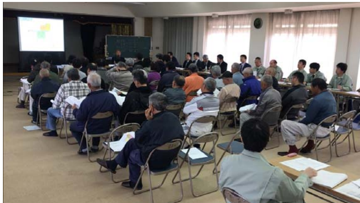
まちづくり勉強会総会の様子

平成30年4月8日（日）10時より、郡川会館にて服部川・郡川地区まちづくり勉強会第4回総会を開催いたしました。勉強会会員総数100名のうち、出席者数33名、委任状出席者数33名の総数66名の方にご出席して頂きました。