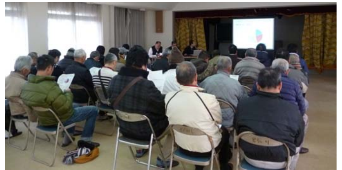
まちづくり勉強会の様子