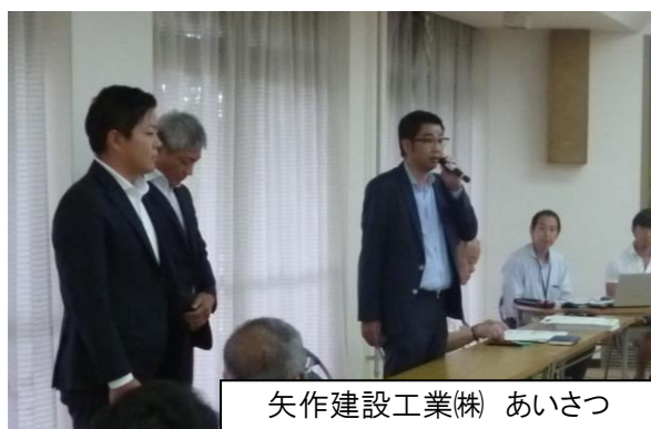
矢作建設工業(株) あいさつ

本総会では、「八尾市郡川地区における土地区画整理事業業務代行予定者募集における選定結果」について審議され、賛成多数により、業務代行予定者を『矢作建設工業株式会社』とすることが決定されました。