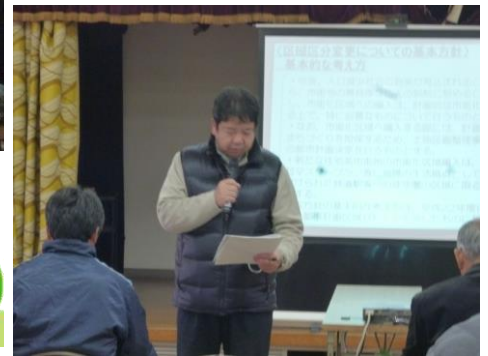
松浦代表 あいさつ

今回は、「区画整理事業の仕組みについて」換地設計や補償について、説明させていただきました。