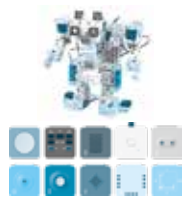
遊びが学びにつながるプログラミング教材