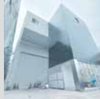
世界唯一の発色技術「アベルブラック」を外壁に用いた新社屋