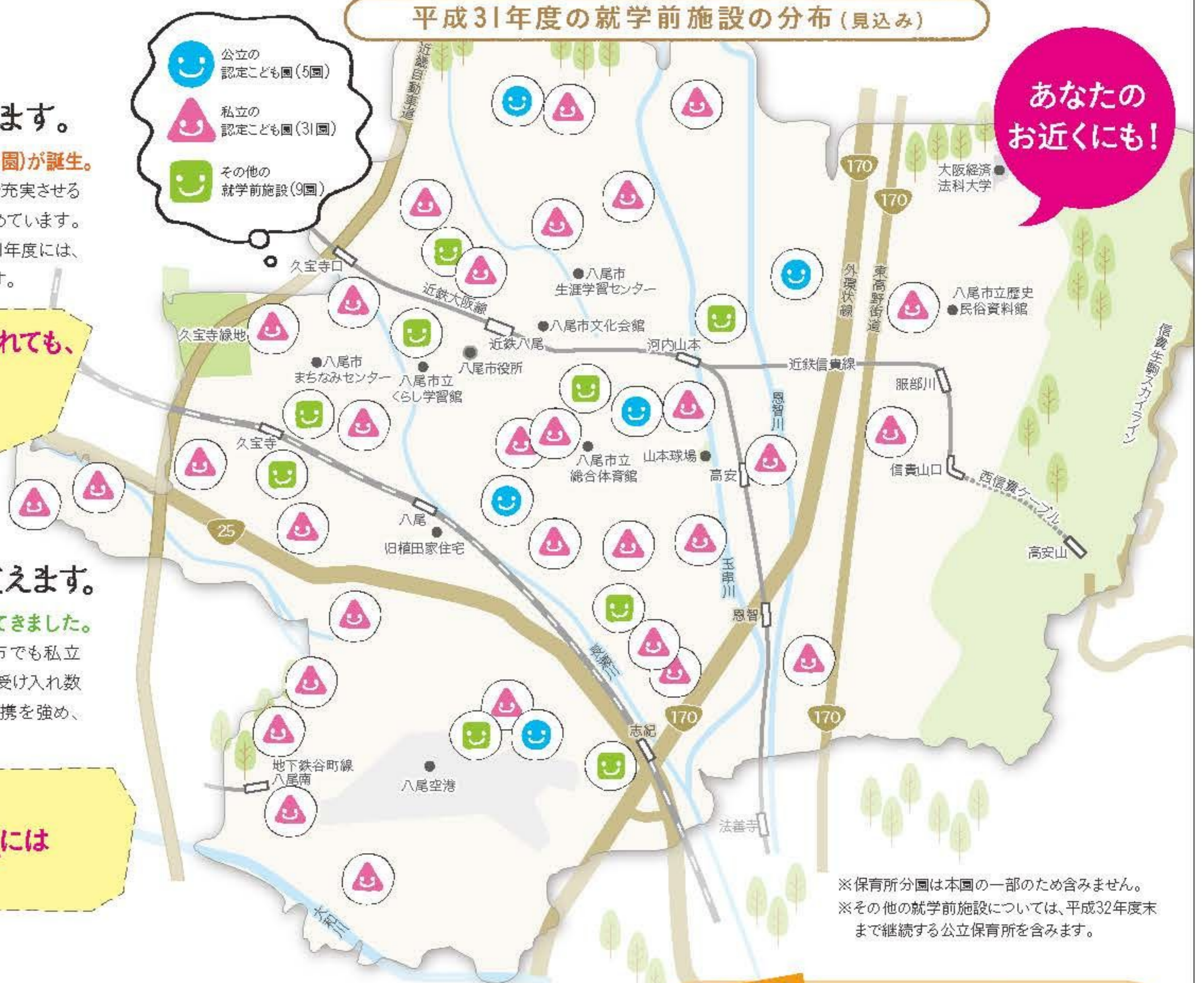
平成31年度の就学前施設の分布(見込み)