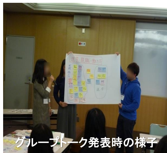
グループトーク発表時の様子

さて、今後この「強み」「弱み」をどのように活かしていくのかは、みなさんお楽しみに♪