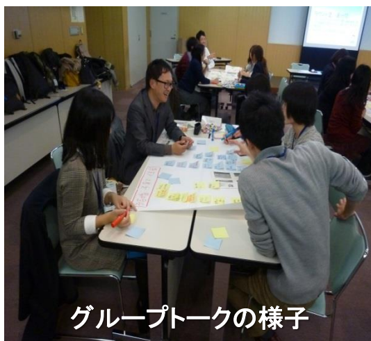
グループトークの様子

OTS会議では、各グループに分かれて、八尾市の「強み」「弱み」ってどんなことがあるのか？といった内容をテーマで分類して、グループトークを行いました。