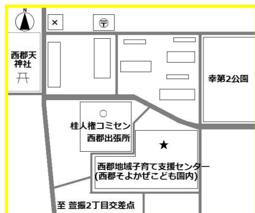
西郡地域子育て支援センター 「そよかせ元気っ子くらぶ」 (西郡そよかせこども園内) 桂町 2-33 TEL/FAX(072)999-2378

※ご自宅で親子共に検温をしてきて下さい。 37.5度以上の発熱がある場合は参加いただけません。 参加される大人の方は、マスクの着用をお願いします。 なお、参加の方には連絡先の確認をさせていただきます。 ご了承ください。 ※新型コロナウイルス感染拡大対策について、内容を変更する可能性があります。変更した際には、ホームページでお知らせします。