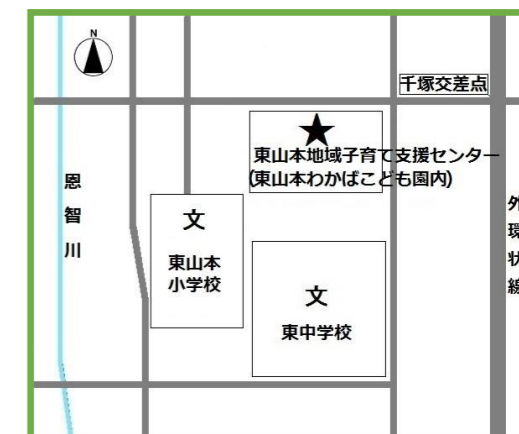
東山本地域子育て支援センター 「わかば元気っ子くらぶ」 (東山わかばこども園内) 東町 3-5 TEL/FAX (072)992-5775