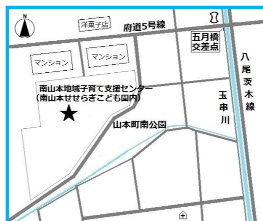
南山本地域子育て支援センター 「せせらぎ元気っ子くらぶ」 (南山本せせらぎこども園内) 山本町南 3-1-39 TEL/FAX (072)991-8867