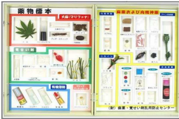
(縦 40cm × 横 60cm × 奥行 10.5cm)