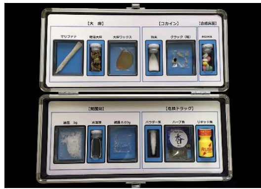
(縦 15cm × 横 30cm × 奥行 5.5cm)