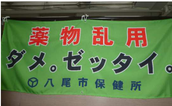
( 縦 80 × 横 180cm )