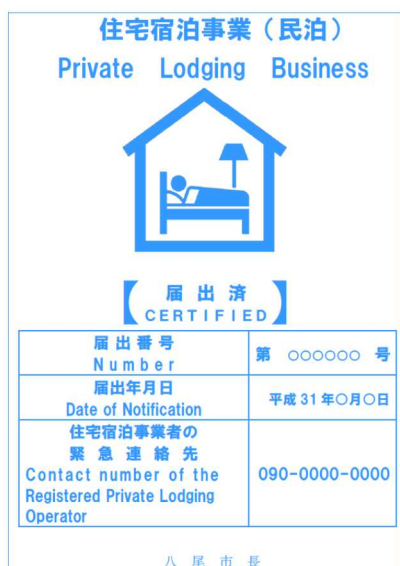
住宅宿泊事業法標識例

届出内容・添付書類に不備がなく届出が受理された場合、八尾市から届出者に対し届出番号を付した標識を原則窓口で交付します。