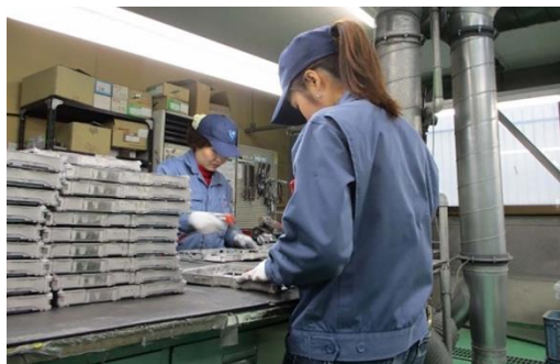
現場で活躍する外国人（女性）社員