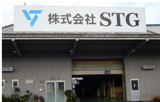
本社・大阪工場 建屋