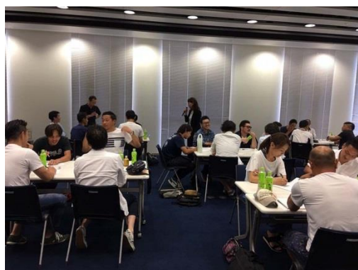
社内勉強会 八尾商工会議所にて

ビジネスマナー研修や、会社全体での応急救護の講習などを実施しているほか、キャリア形成においての様々な資格取得の支援などを行っています。