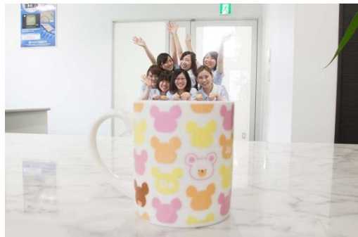
CAD/CAM、三次元測定、事務所 それぞれの部署で女性が活躍しています！