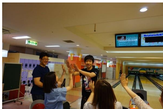
毎年恒例のボーリング大会です。 社内行事を通して社員同士の仲を深めています♪