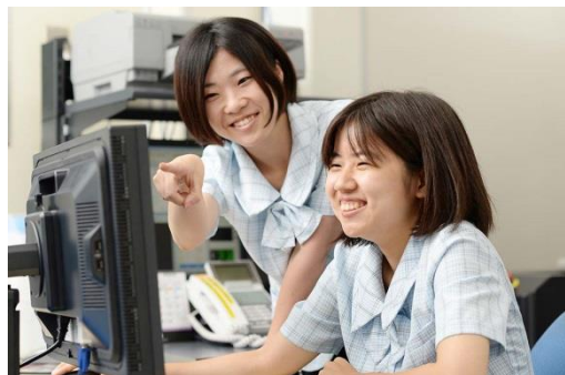
「メンター制度」で先輩社員が1対1で教えます！