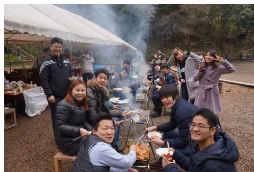
今年の4月に行ったお花見&BBQの風景です。 当社の社内行事は全て全員参加です！