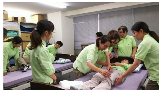
研修 Step ③ 担当サービス毎の基礎知識習得の「身体介護研修」

仕事と介護を両立できる職場環境の整備に取り組む企業として認定され、「トモニマーク」を取得（2015年6月）。