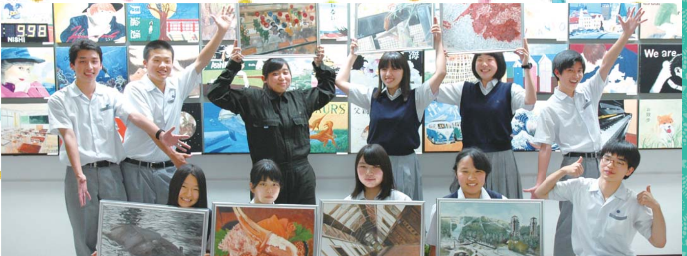
金光八尾高校美術部の皆さん

今回で4回目となる市議会×高校生プロジェクトでは、金光八尾高校美術部から表紙作品を提供いただきました。圧倒的な野獣の目力に高校生のパワーを感じますね。また、議会のことを少しでも身近に感じてもらうべく、金光八尾高校美術部の皆さんに議会制度について市議会事務局の出前講座を行いました。