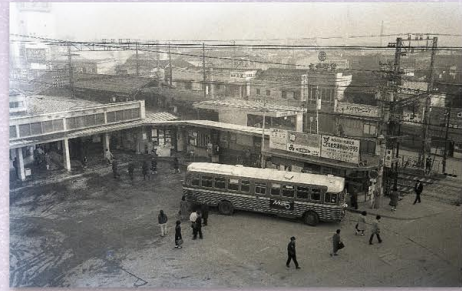
旧近鉄八尾駅 昭和40年代 持田寿一氏写真資料