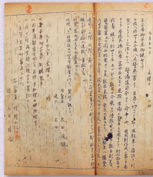
大阪府立八尾中学校当直日誌 (部分、進駐軍宿泊につき) 昭和20年9月27日 大阪府立八尾高等学校資料館所蔵文書