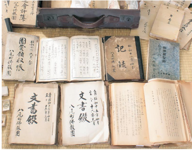
八尾仏教会関係史料 昭和二年～三年