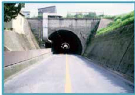
当初の河内地下道