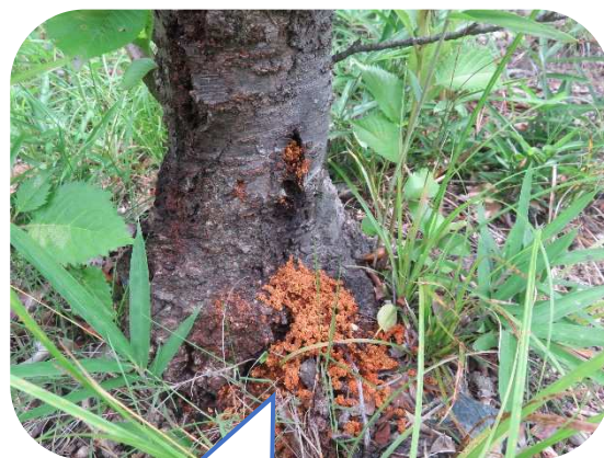
根元にたまったフラス