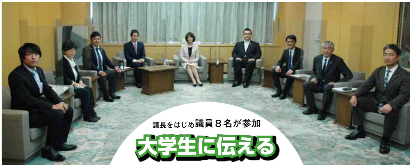
議長をはじめ議員8名が参加