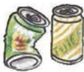
【ビール・ジュースの缶】