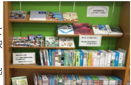
志紀図書館での教科書展示会の様子

教育サポートセンターでは、展示会以外は常時教科書の貸し出しができるよう展示しておりますので、ぜひご利用ください。