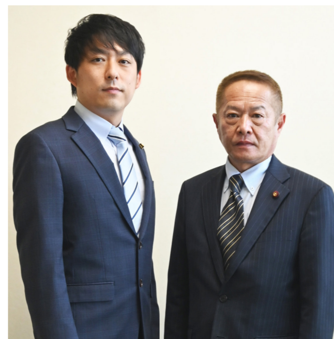
副議長 よしむら たくや 吉村 拓哉