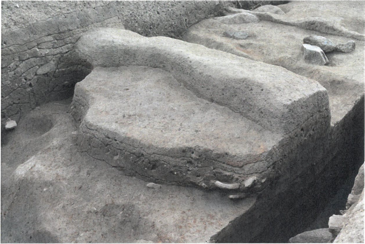
写真1 基壇東端・階段土の一部