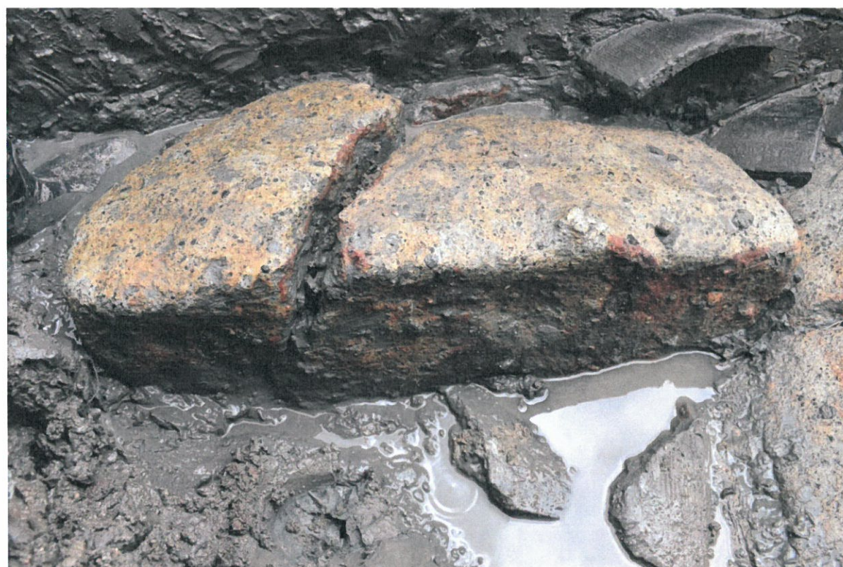
写真 5-2 基壇外装材（北から）