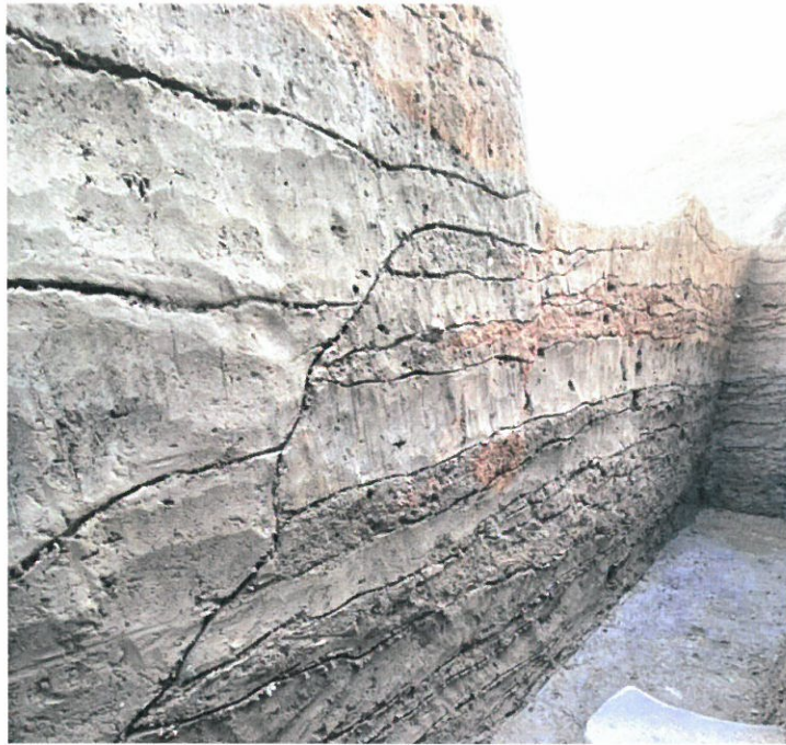
写真3-1 上層基壇(由義寺)・下層基壇(弓削寺カ) 版築層