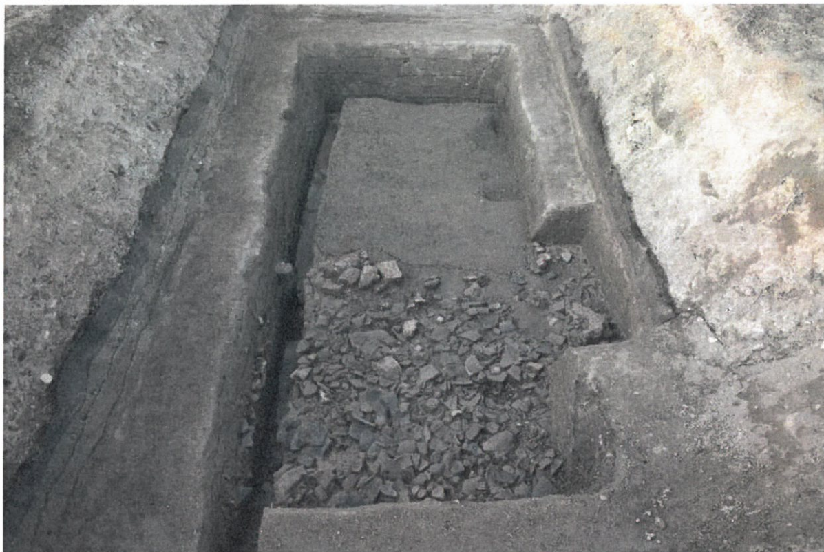
写真6 史跡指定地北東隅検出の瓦だまり