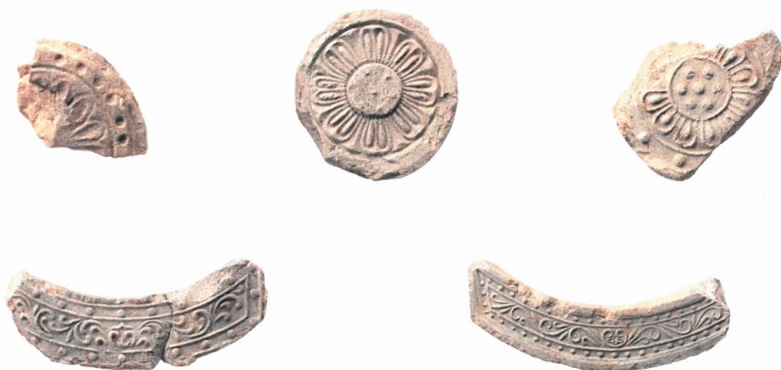
写真9 由義寺塔基壇周辺から出土した瓦（八尾市調査分）