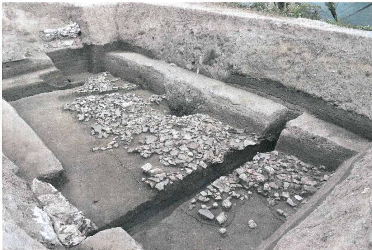
写真8 瓦だまりの範囲確認調査