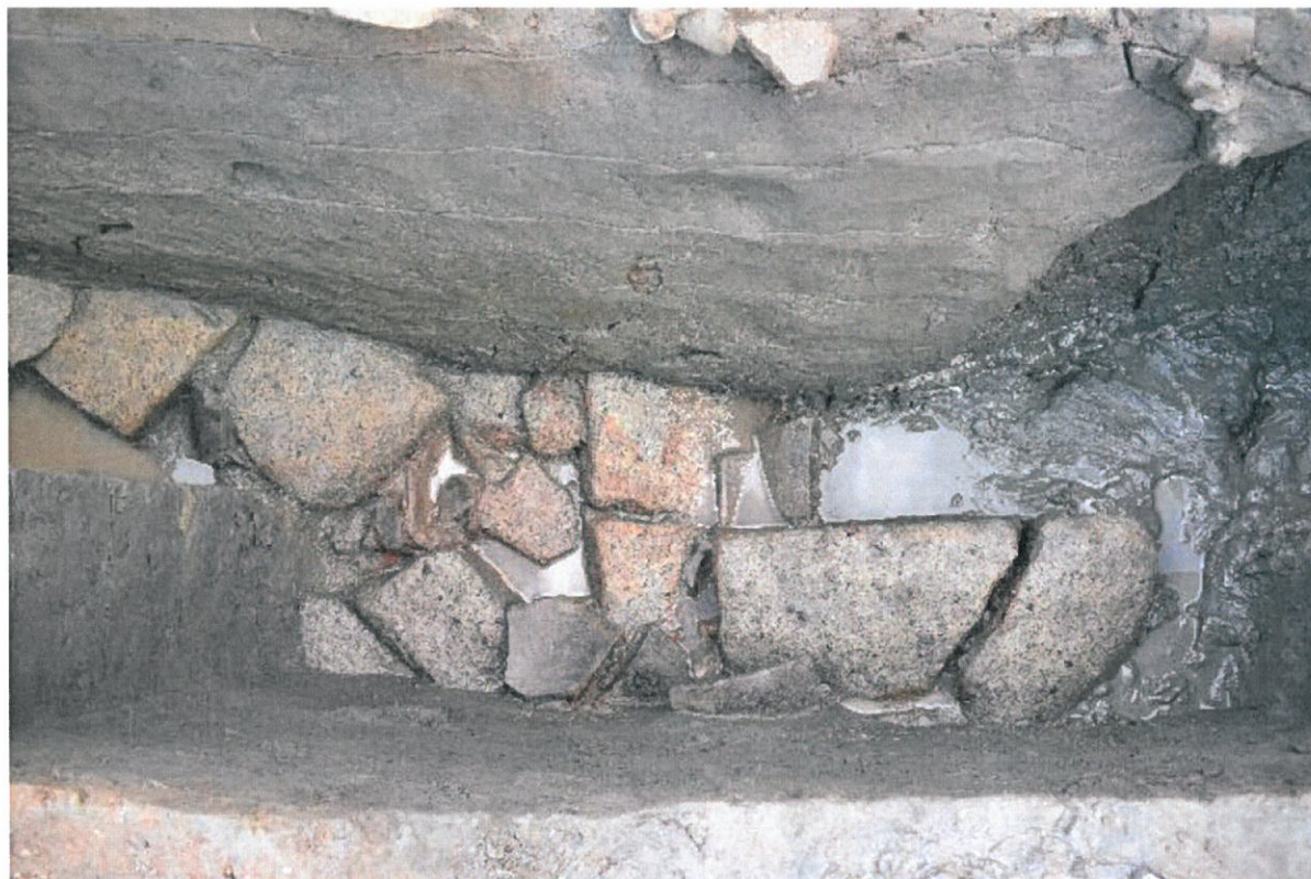
写真 5-1 下層基壇裾付近で検出した凝灰岩基壇外装材