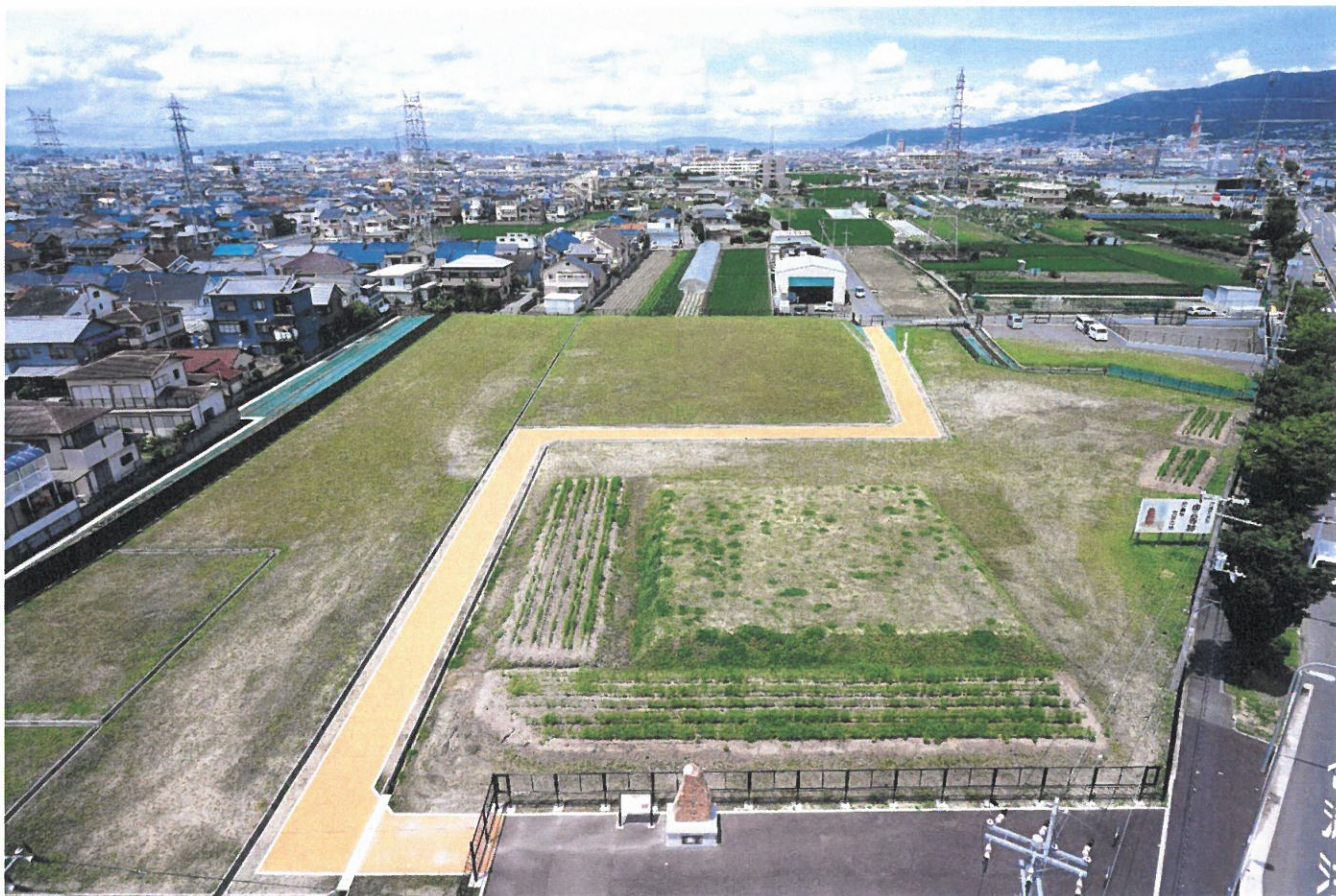
写真10 史跡指定地現況（南から）