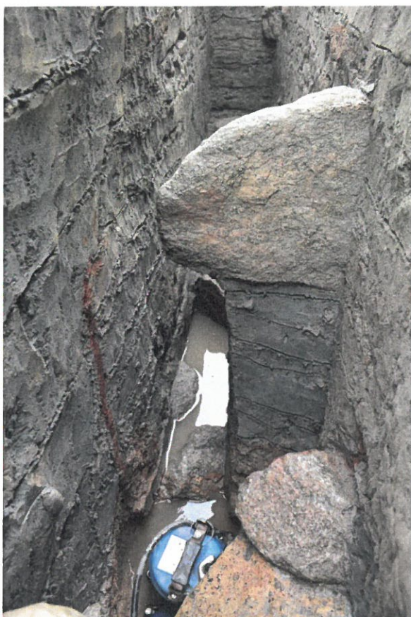
写真4-1 基壇下層確認