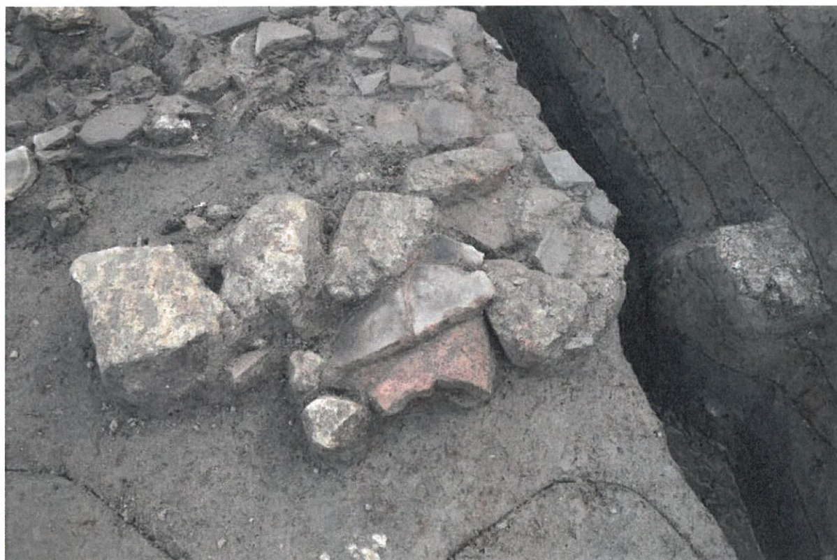
写真7 瓦だまり内検出の凝灰岩