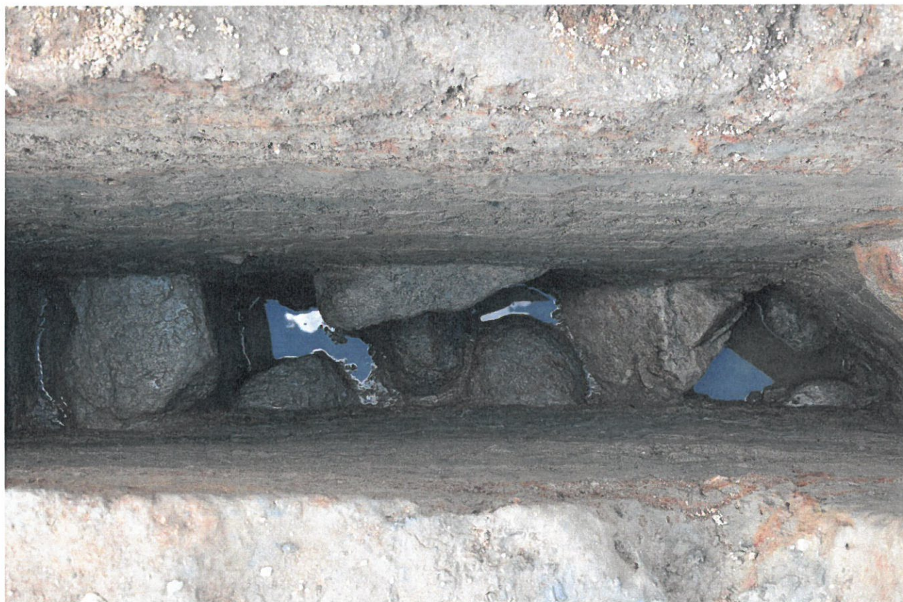
写真4-3 掘込地業内の石材