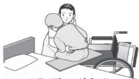
スライディングボード

対象者の体幹をやや前傾した状態で、左右交互に傾けて荷重を片側の臀部にかけ、次に荷重がかかっていない臀部の膝を車椅子背もたれ方向へ押すことで深く座ることができる。滑りにくい座面の場合は、片側のみスライディングシートを座面に敷き、同様に膝を押すことで滑りやすくなり深く座ることができる。