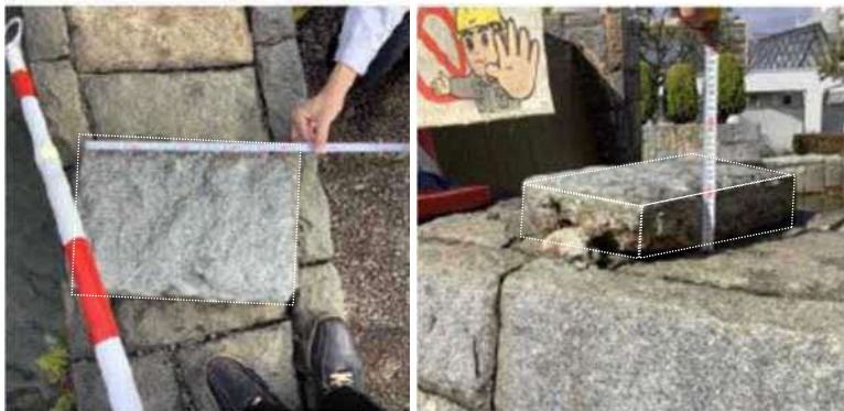
外れた修景用の石