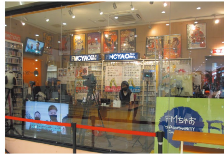
収録の様子をパチリ