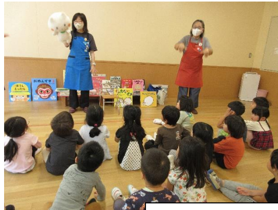
図書館員さんがこども園に来てくれました