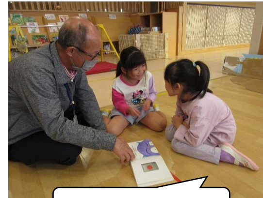
このぼたん押してみる？