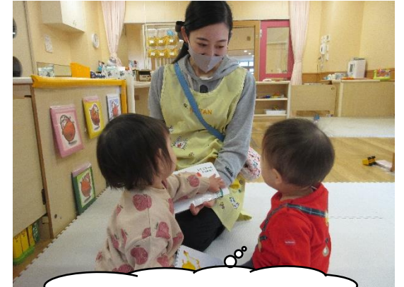
次はどうなるのかな～

先日、2歳児が志紀図書館へ行き、借りてきた絵本を「(おうちに)持って帰る」「もう1回(読んで)」と手放しがたいほど、絵本が大好きになっています。0、1歳児も絵本を読んでもらうと体を揺らしたり、その絵をじっと見つめたりしています。幼児クラスでは、友だちと一緒に楽しんだり、わからないことを図鑑などで調べたりする姿もあります。ぜひ、絵本貸し出しを利用して親子で一緒に楽しんでくださいね。