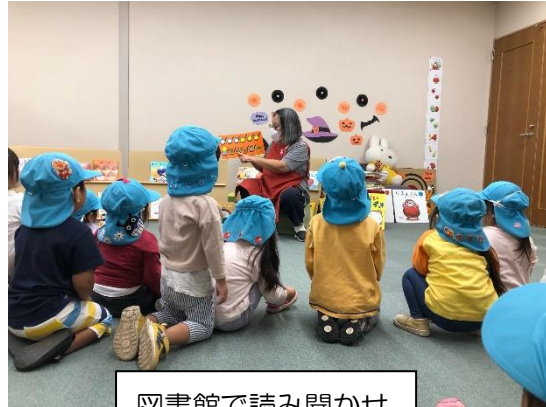
図書館で読み聞かせ

新型コロナが流行し、ストップしていた絵本貸し出しが再開されました。この間、こども園で保育者や志紀図書館、「おはなしかびごんさん」の読み聞かせを楽しんでいた子どもたちです。